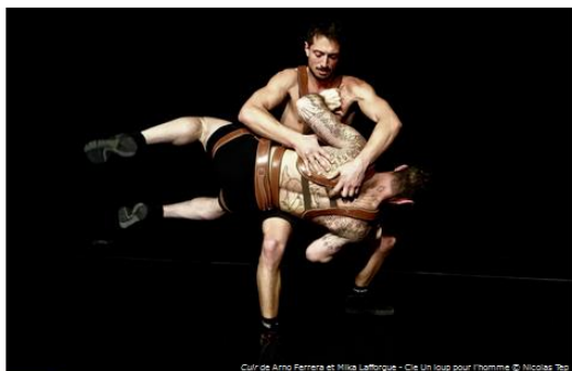
Cuir de Arno Ferrera et Mika Lafforgue - Cie Un loup pour l'homme

Opinions Critiques Tête-à-tête Analyses Vidéos Affinités Agenda Abonnement Rechercher