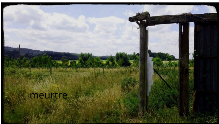
Proposition de travail vidéo : Cléo Sarrazin

Le film devenant tableau, par son évolution graphique, l'image sera "dégradée" par des gestes picturaux comme des éraflures, parce que la fable reste pour toujours un miroir intemporel et universel de la condition humaine.