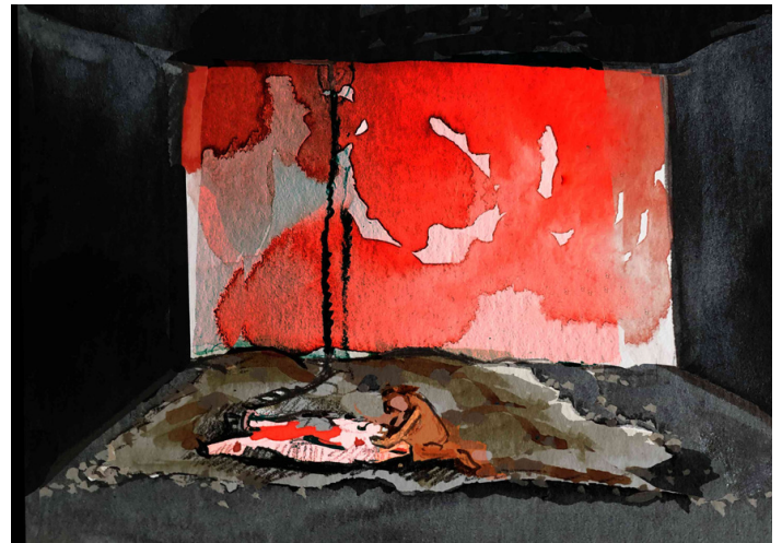
Proposition de scénographie (dessin Johanne Huysman)