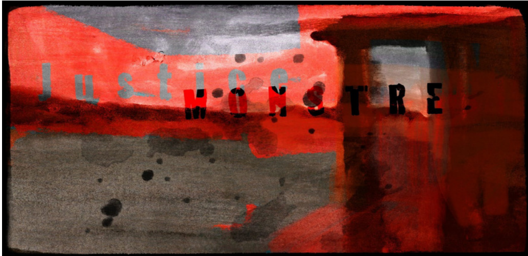
Proposition de travail vidéo : Cléo Sarrazin

Les bruits du monde (entre les 2 parties de la pièce)