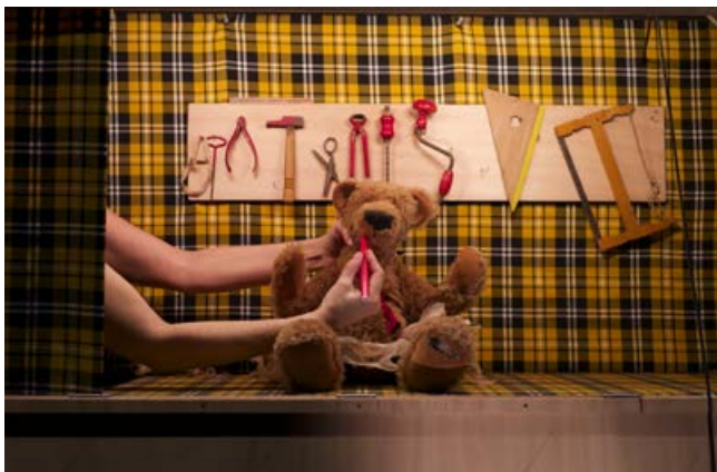
Nui © Didier Martin