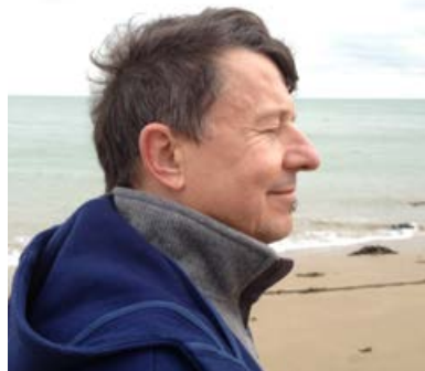
Comme vider la mer...