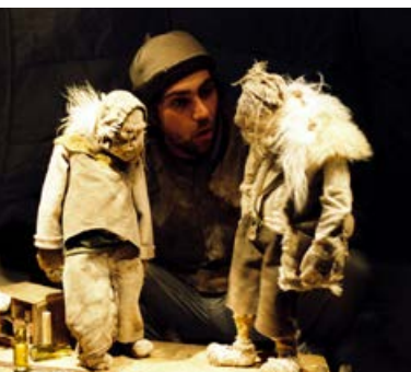
Les Nuits polaires

➤ ven. 29 avr. | 20 h DURÉE ± 2 H | TARIF 8 €