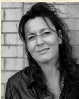
Anne Conti © D.R.