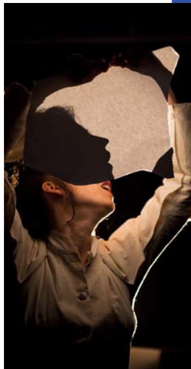
Du Rêve que fut ma vie © Vincent Muteau