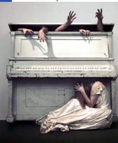
Les Noces de Figaro