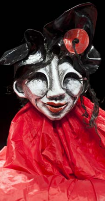
Une cArMen en Turakie