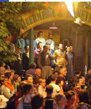
La Quermesse de Ménétreux

➤ sam. 11 juin GRATUIT SUR RÉSERVATION LIEU ET HORAIRE À PRÉCISER