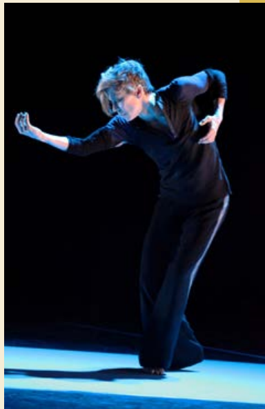
So Blue