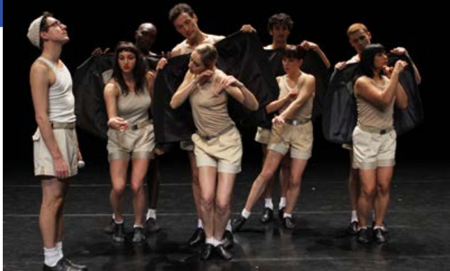
L'Enfance de Mammame