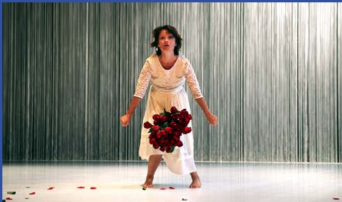
La Belle