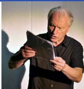
Valère Novarina, Le Vivier des noms

➤ ven. 13 mai | 20 h DURÉE ± 1 H 30 | TARIF 8 €