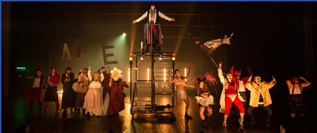
Henry VI, cycle 2 © Nicolas Joubard