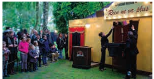
Rien ne va plus ! Casino Forain

DEVANT LA MAISON DE QUARTIER LA TIMONERIE RUE ANDRÉ-MALRAUX