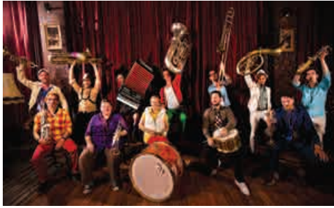
Orchestre International du Vetex