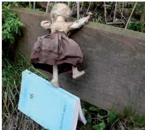
À quoi ça sert un livre ? © Johanne Huysman