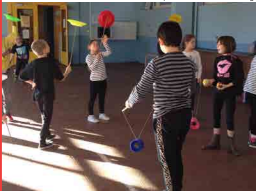
Atelier de sensibilisation au cirque

Pour tout renseignement, conseil et réservation de places, vous pouvez contacter :