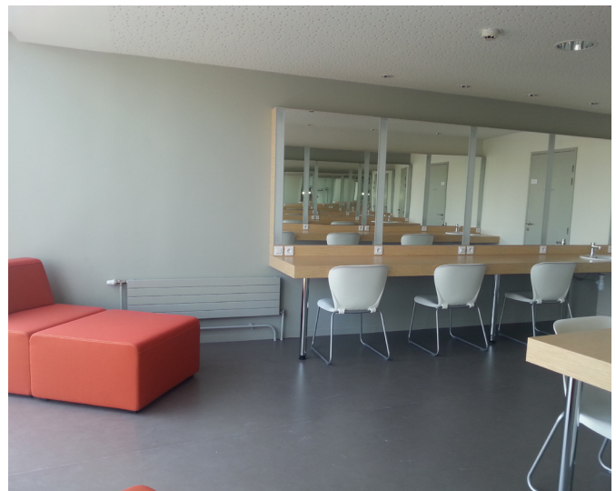
loge 6 personnes

loge 1 (2 personnes + douche) loge 2 (6 personnes + douche) loge 3 (6 personnes + douche)