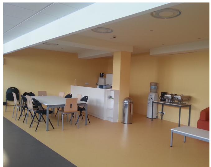
foyer des artistes