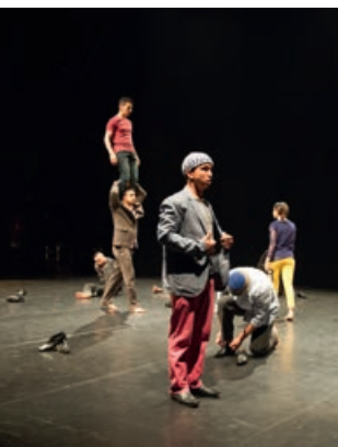
Résidence création Holko