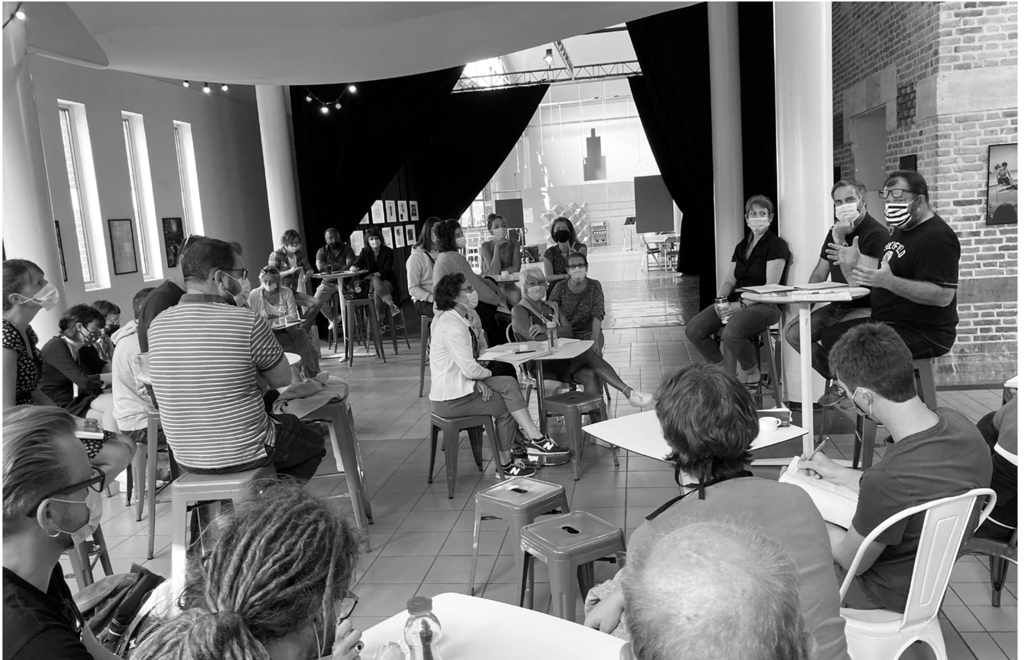
réunion plénière - septembre 2020