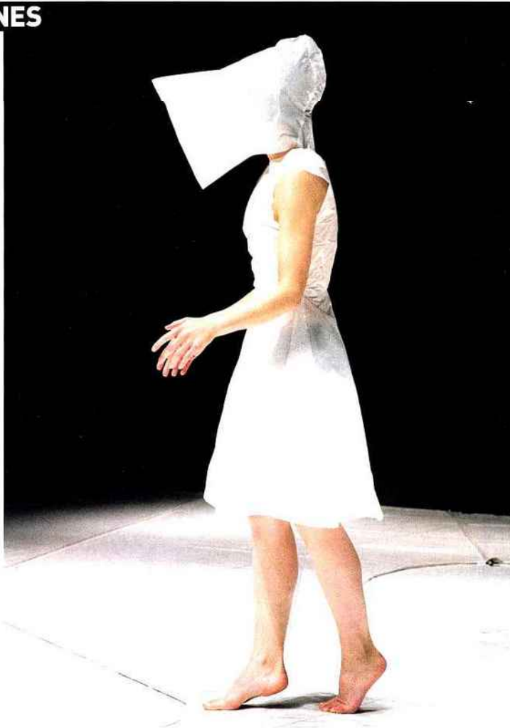
Matter de Julie Nioche/AIME © Photo : Jérôme Delatour - Images de danse.