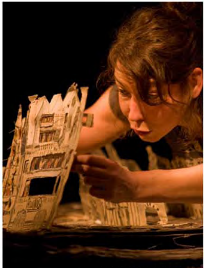
Camille Chalain / Le Clou dans la Planche

Ce journal est donc un véritable livre animé, ou plus communément désigné aujourd'hui de livre Pop-up. La chose n'est pas nouvelle, et certains se souviendront encore de celui