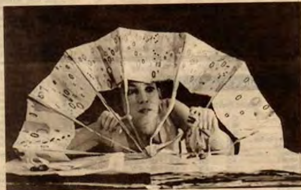
Le Cri Quotidien. Chaque rubrique du journal comme une pochette surprise...

Jusqu'au 8 juin au Théâtre Jeune Public - rue des Balaiseurs à Strasbourg. ☎ 03 88 35 70 10