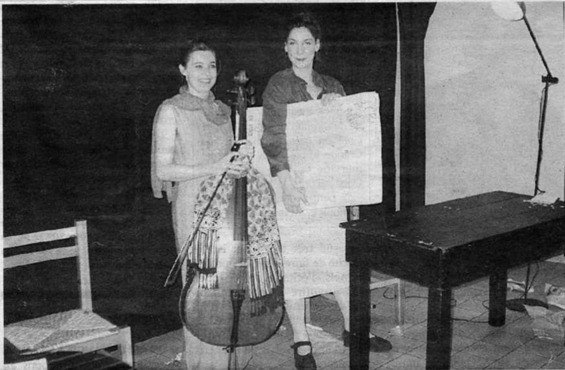
Comédiennes. Deux membres de la compagnie Les Anges au plafond, interprètes du spectacle « Théâtre en appartement »