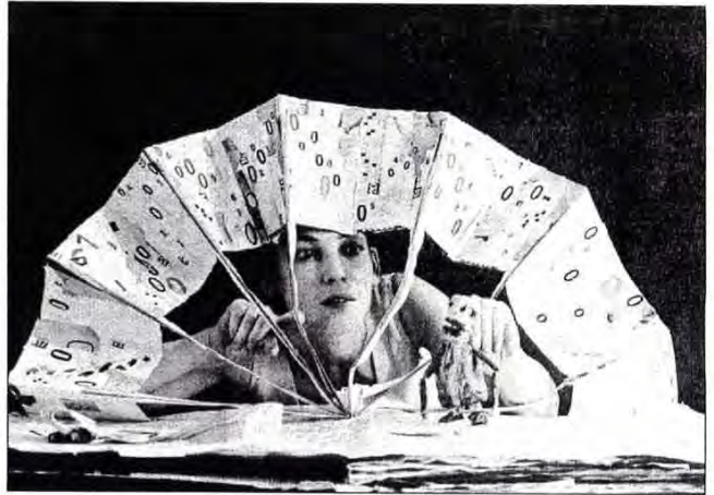
La compagnie desANGES au plafond donnera un spectacle gratuit à l'issue de la présentation de la saison culturelle.

Renseignements, réservations et abonnements : CCAC, PEPSI, Boîte à musique, 02.54.21.66.13.