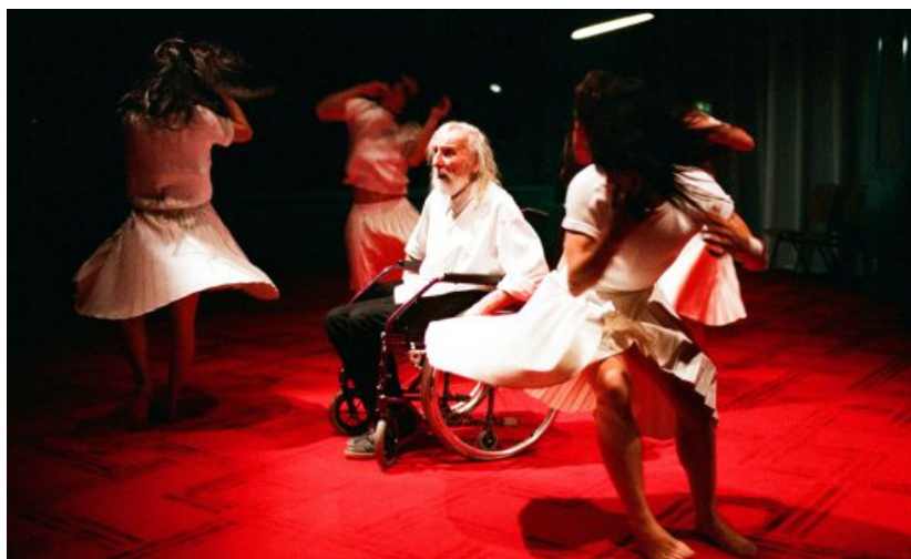
La apuesta de la compañía belga cautiva y agrade a la vez al espectador, una marca de la casa.

Archivado en: Festival Grec Peeping Tom Compañías danza Danza Festivales teatro Cataluña Festivales Teatro España Artes escénicas Eventos Espectáculos Sociedad