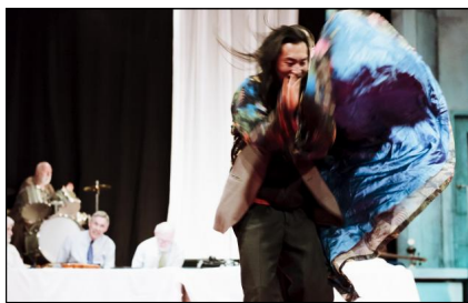
„Vader“ von Peeping Tom

„Vader“ ist der erste Teil einer Trilogie, über Mutter und Kind will sich „Peeping Tom“ auch noch hermachen. Man darf gespannt sein!