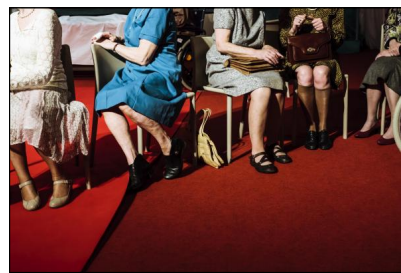
„Vader“ von Peeping Tom