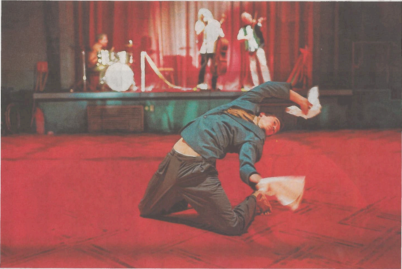
Peeping Toms Inszenierung „Vader“, eine Gespinnst feiner Fallstricke.