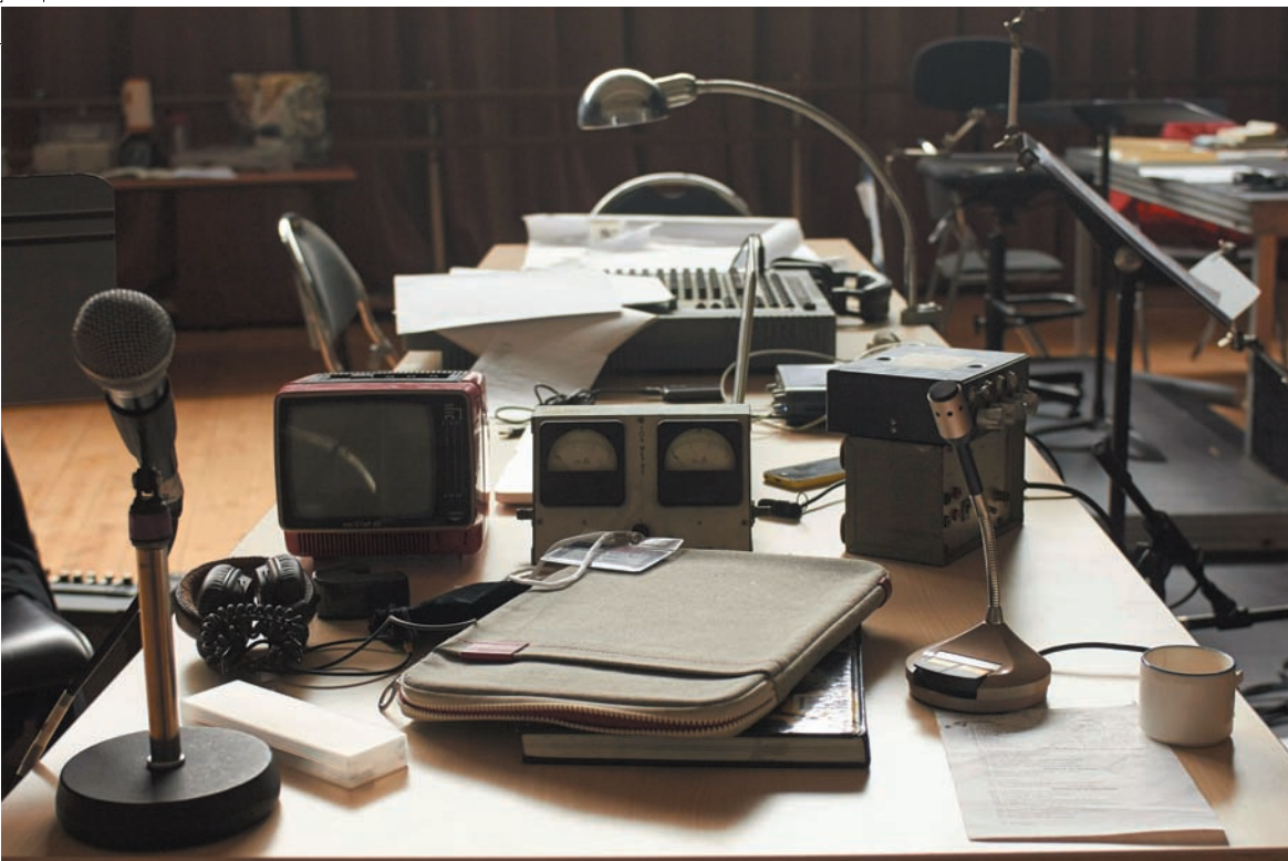
Les Constellations