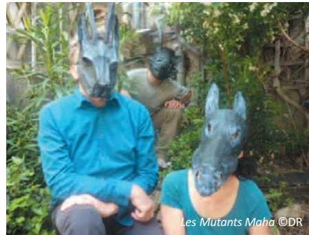
Les Mutants Maha

Réservations Le Vivat Scène conventionnée danse & théâtre Place Saint-Vaast, Armentières +33 (0)320 77 18 77 www.levivat.net