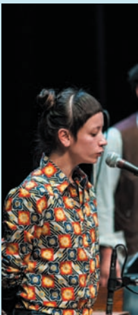
Moondog