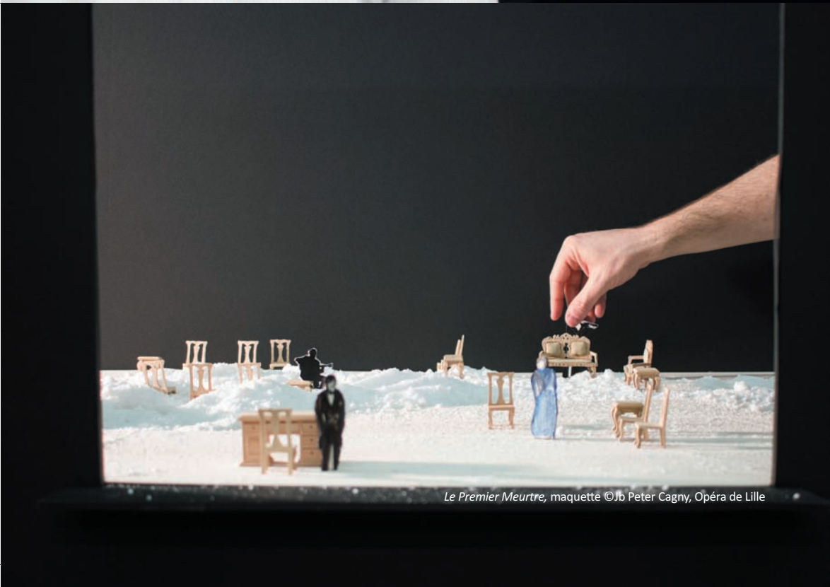
Le Premier Meurtre, maquette ©Jb Peter Cagny, Opéra de Lille