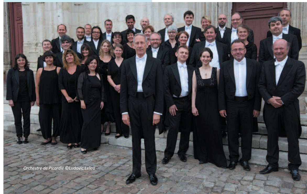
Orchestre de Picardie