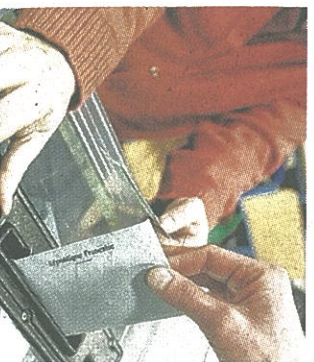
Les enfants vont faire comme les grands : élire leurs représentants.

Le conseil municipal des jeunes sera élu jusqu'en 2019. Il travaillera tout particulièrement sur l'école, les sports, les loisirs,