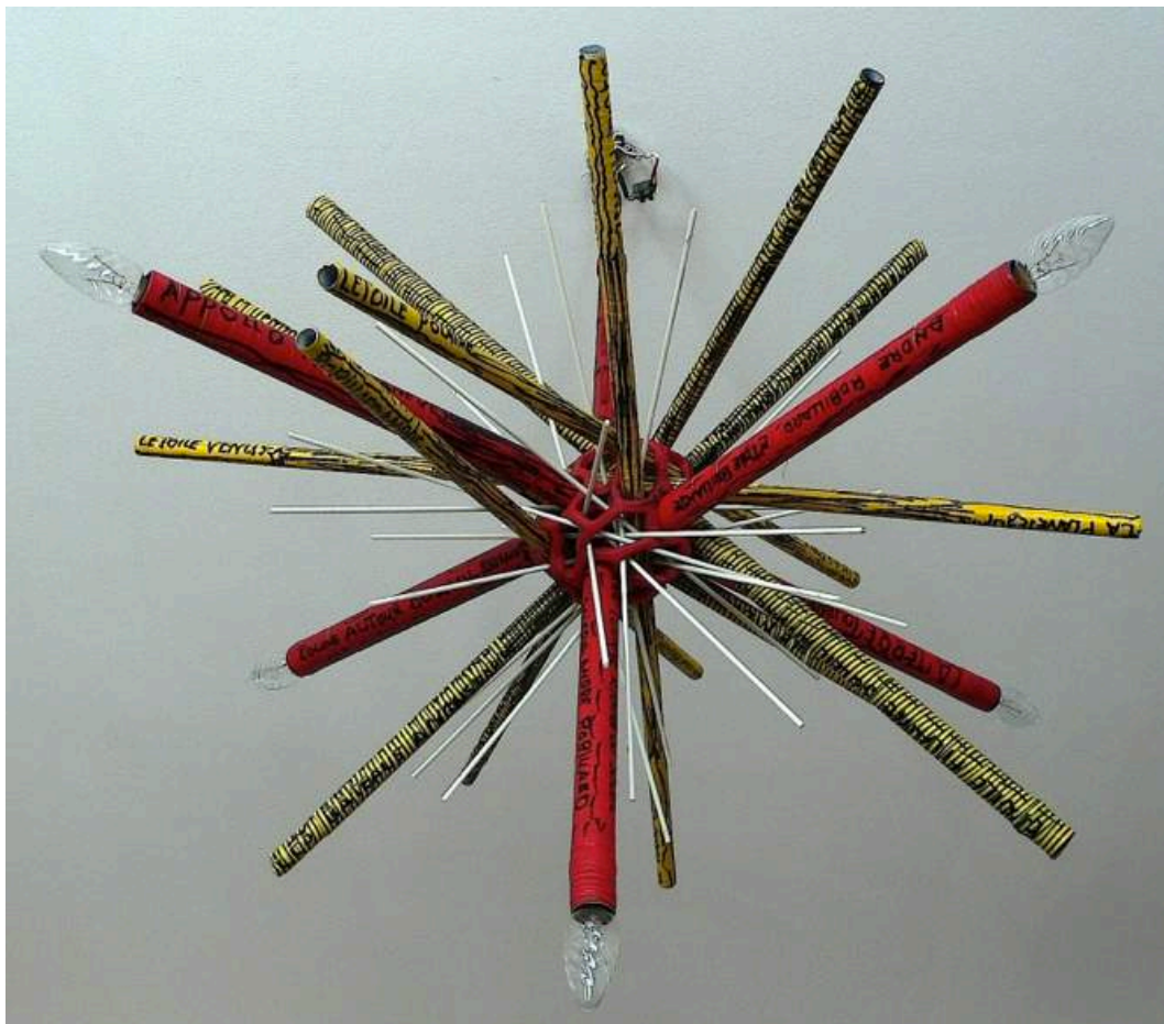
"Le Soleil", André Robillard

La Reine des Abeilles est la mémoire vivante de la planète. En fuyant la surface de la terre les hommes ont offert sans le savoir une seconde chance aux animaux et à la nature. Petit à petit, les abeilles se sont désintoxiquées des engrais chimiques et des pesticides. En 2516 elles vivent en totale harmonie avec les Kipit et ne tiennent pas du tout à ce que les souterrains regagnent la surface de la terre.