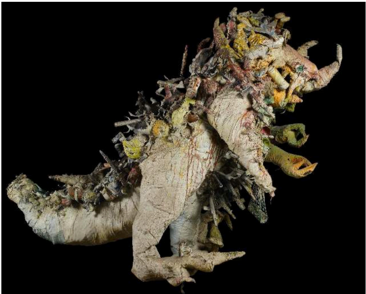
"Le Monstre de Soisy", Niki de St Phalle (1966)