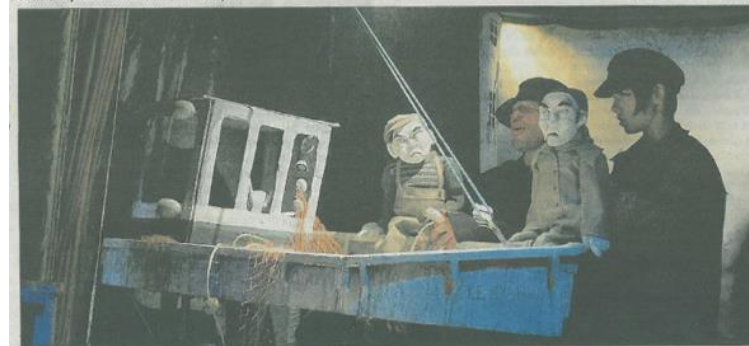
Tout seul réveille notre part d'humanité

Tout seul par le théâtre du Rugissant. Aujourd'hui à 17 h 30 et 19 h 30 et demain, mardi, à 17 h 30 et 19 h 30 à la roulotte du Rugissant, plaine du Mont-Olympe.