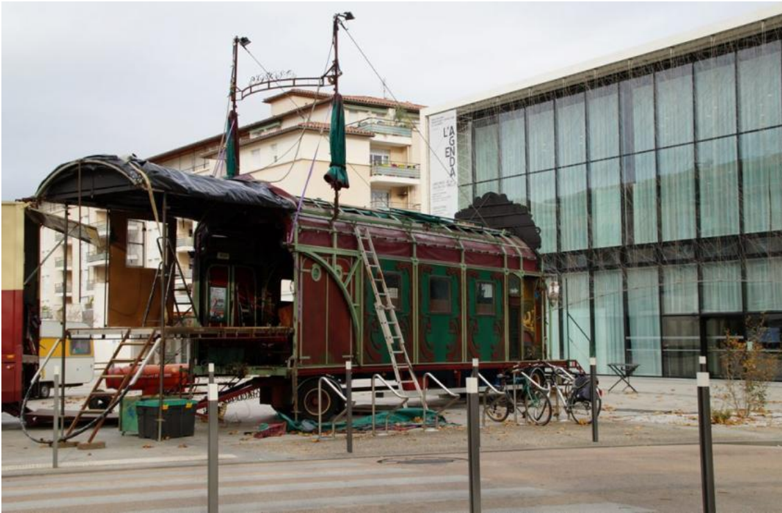
La roulotte sera prête à accueillir le public aujourd'hui face au Pavillon Blanc.

Publié le 15/11/2013 à 03:50, Mis à jour le 15/11/2013 à 09:24