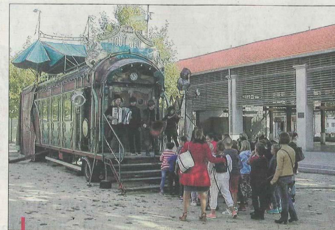
Hier matin, ce sont les scolaires qui ont eu le privilège de la manifestation. Rendez-vous demain pour le grand public.

Autre coup de cœur : librement inspiré de la BD de Chaubouté, un spectacle intime et plein de poésie, installé dans une magnifique roulotte-théâtre : Tout Seul est une ode à l'imaginaire, une aventure pleine d'espoir. Si vous avez envie d'humour, allez faire un tour du côté du jongleur-magicien de l'Atelier Lefevre & André : sûr qu'il saura vous surprendre ! Également, une camionnette charmante et désuète qui ouvrira son ancre tel un entresort littéraire à apprécier en toute confiance.