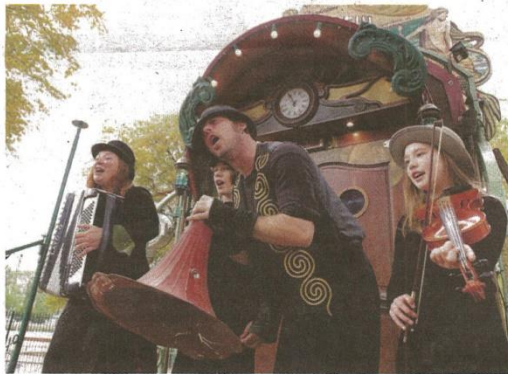
Une famille d'artistes, une magnifique roulotte et la promesse d'un beau voyage.

À l'intérieur de cet écran, le théâtre du Rugissant manie de magnifiques marionnettes, mais fait appel aussi au chant, à la musique d'un petit piano et d'un accordéon, aux bruitages de sons marins et au théâtre. Cette entreprise artistique familiale, riche d'un savoir-faire artisan, fait comme à son habitude : elle travaille chaque détail avec l'amour des arts forains et