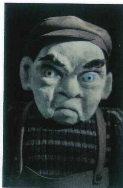
Théâtre Rugissant © Jean Maxeiller