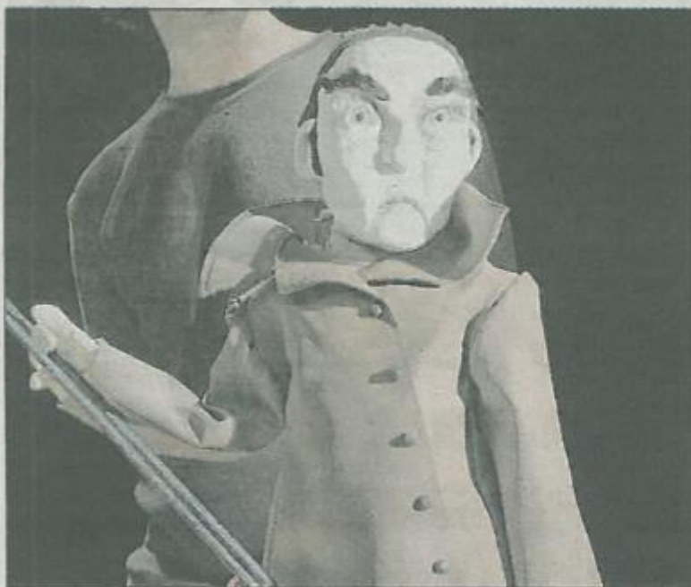
L'œuvre de Christophe Chabouté est à l'origine du spectacle.