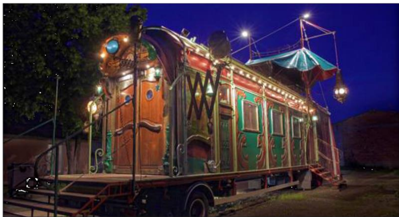
La superbe roulotte-théâtre du Théâtre du Rugissant.