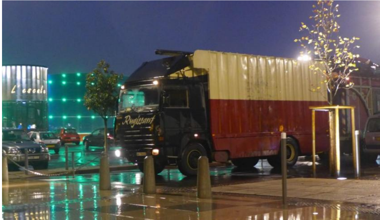
Le théâtre du Rugissant arrivant devant l'Escale.

Lundi à 17 h 30, l'impressionnant camion tractant la roulotte théâtre et son convoi de caravanes, faisait son entrée dans Tournefeuille, «théâtre du Rugissant» écrit en gros sur la cabine. La pluie eut le mérite, en cette soirée glaciale, de faire briller les dalles de la nouvelle place, pour une arrivée féerique. Au volant des véhicules qui bouchaient la rue dans un grand balayage de phares : une famille. Derrière les boiseries de ce théâtre ambulante : la promesse d'une restitution : celle de l'enfance, de l'imagination, de la capacité à s'émerveiller. Pas étonnant alors que l'on puisse rester à les regarder s'installer, attendant son plaisir comme au pied d'un arbre de Noël. On comprend ce que dit Jean Kaplan, directeur de l'association Marionnettissimo : «un jour je les ai croisés sur la route, ils avaient fière allure !». La Dépêche du Midi