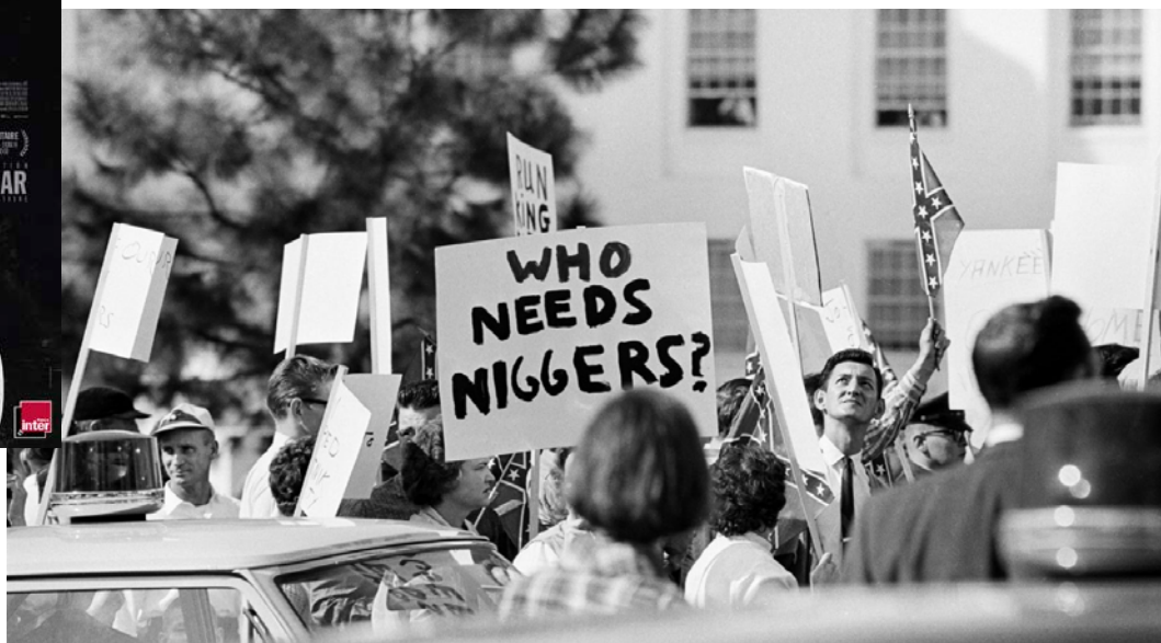
I am not your negro Raoul Peck / Velvet Film © 2016

« L'usage de la vidéo permet de redéfinir l'espace. Le fond de scène devient fenêtre sur le temps et l'espace. La projection simple, radicale, graphique et documentaire de média 2D et 3D est le prolongement du geste chorégraphique. Les images d'archives, les motions design et les jeux typographiques nous immergent dans une époque d'innovation, de modernité et d'injustice sociale. La voix de James Baldwin est le support d'une narration ouverte : la base qui donne le rythme, la beauté du swing, et la douleur de son origine complexe. »