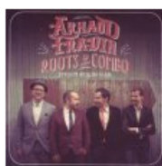
Mojo Hand Records https://www.rootscombo.com