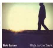
Lucky Bear Records