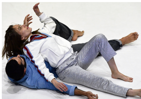
Danse et récits autour de la mort

« Des danseurs, acrobates, comédiens, artistes de cirque racontent comment ils sont morts. Et en racontant comment on meurt, on raconte nécessairement comment on vit. Il s'agit de parler de la mort en la traitant par le corps et la parole parce que le corps peut porter des choses que le texte ne peut pas véhiculer et inversement. Cette combinaison dit, sans redon-