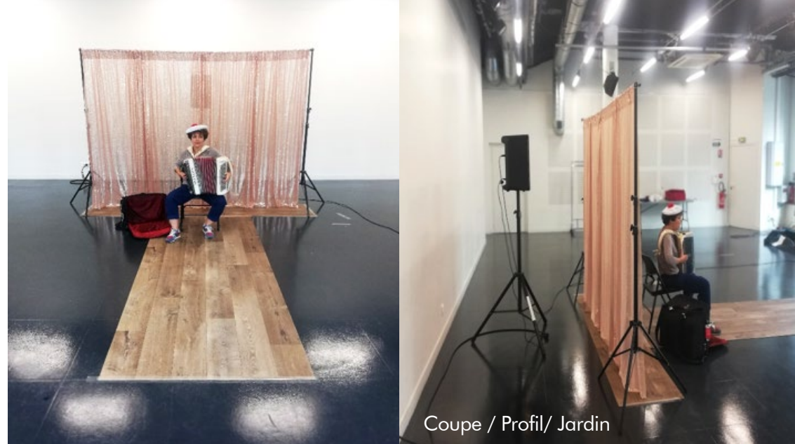
Coupe / Profil/ Jardin